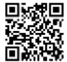
線上預約個別諮商

個別諮商是以一對一的談話，幫助我們自我探索及處理困擾。討論的內容包含認識自己、人際互動、家人相處、生涯或課業煩惱、性別認同、情緒或精神困擾等。有煩惱都可以來談！ 談話的過程是保密的 ，歡迎同學線上預約，或直接來中心諮詢。