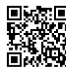
線上預約醫師諮詢

諮商中心每學期都會規劃身心科醫師駐校諮詢服務，如果有憂鬱情緒、焦慮緊張、思考控制不住、精神不濟、睡眠困擾、吃不下或吃太多等狀況，或是精神科藥物的問題，都歡迎預約醫師諮詢，透過醫師的專業意見協助我們面對身心困擾。